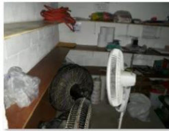
New shelves for materials