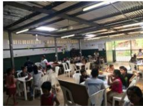
New fans in AMPED (2)