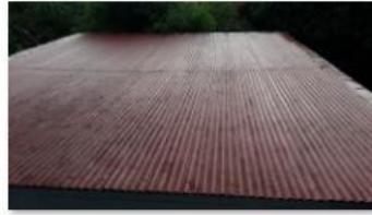
Clean and painted Ceiling (3)