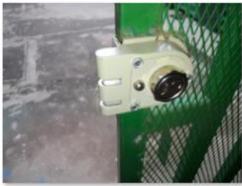
New locks (2)