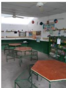
Repaired tables (3)