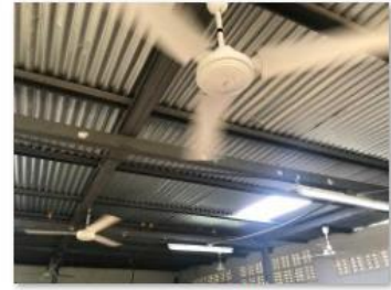
clean and oiled fans