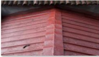
Clean and painted Ceiling (2)