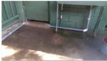
New drainage for the drinking fountains