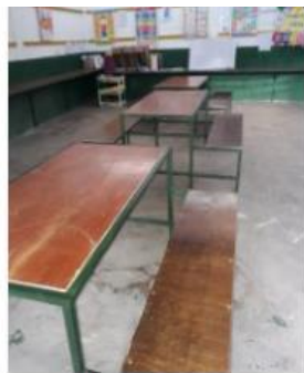
Repaired tables (1)