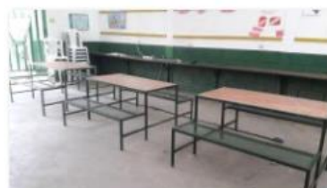
Repaired tables (4)