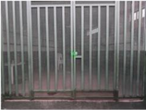
Gates repaired (1)