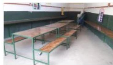
Repaired tables (2)