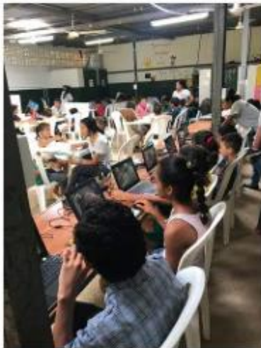
New fans in AMPED (1)