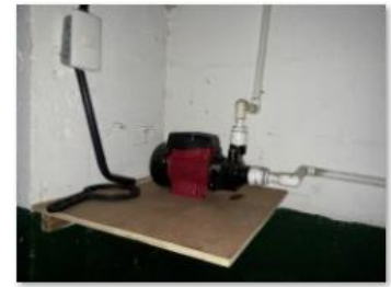
New water pump