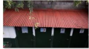
Clean and painted Ceiling (4)