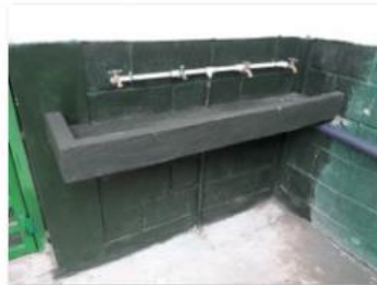
New drinking fountain in Escudo