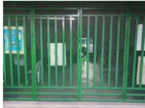
Gates repaired (2)